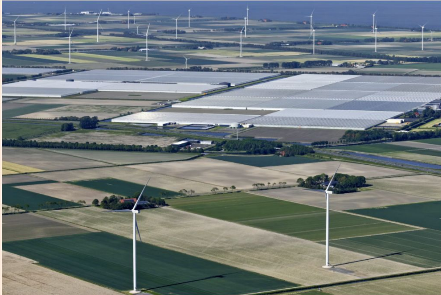
Windmolens in Windpark Wieringermeer in Noord-Holland.