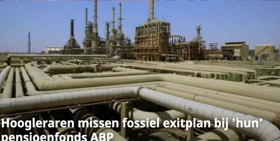
Hoogleraren missen fossiel exitplan bij 'hun' pensioenfonds ABP