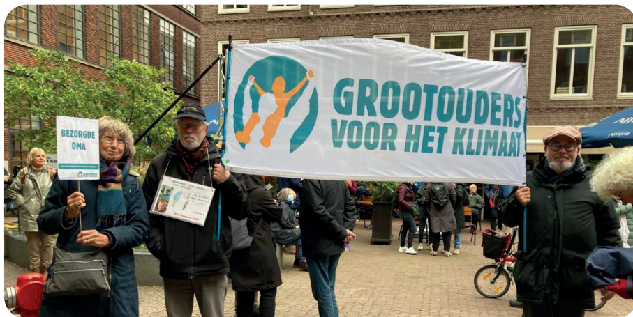
Foto: de Brakke Grond was één van de verzamelplaatsen

Hieraan werd deelgenomen door een delegatie van de Grootouders, naast veel andere organisaties en individuele burgers.