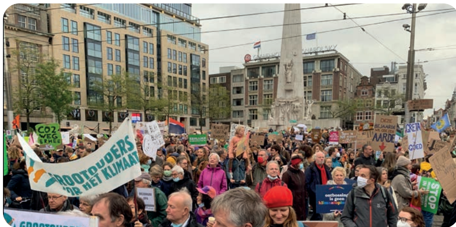
Foto: met vele anderen op de Dam, het beginpunt van de klimaatmars

21 mei: Mede ondertekening van het Memorandum of Understanding van de Klimaatcrisiscoalitie. Belangrijkste wijziging is dat “klimaatrechtvaardigheid” nu als centrale doelstelling wordt geponeerd.