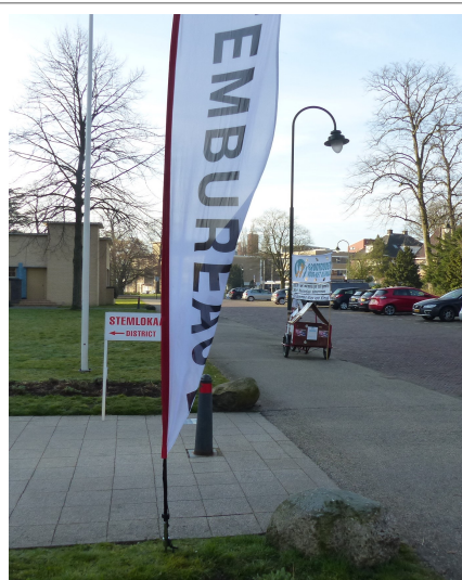
Acties van Hilversumse Grootouders tijdens verkiezingstijd 2022

We zijn benieuwd wat dat plekje ons gaat kosten.