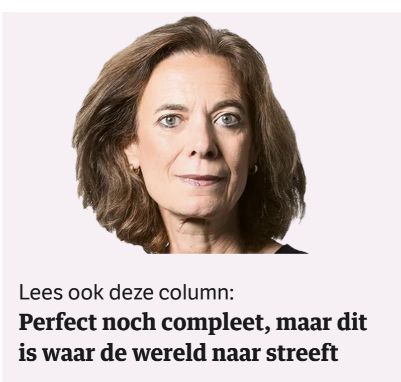
Lees ook deze column: Perfect noch compleet, maar dit is waar de wereld naar streeft

Ook wordt een gerichte Afrika-strategie opgesteld, die beoogt gelijkwaardige economische ontwikkeling te stimuleren, armoede te verminderen, mensenrechten te verbeteren en irreguliere migratie te beperken. Het is belangrijk dat deze strategie veel verder kijkt dan ontwikkelingsamenwerking en de bevordering van handel vanuit Nederland, en zich richt op de ontwikkeling van arme landen zelf, terwijl we bewust de negatieve gevolgen van ons handelsbeleid aanpakken.