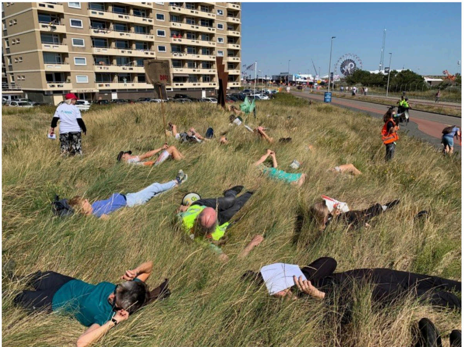
'Dood liggen' bij het circuit.

Een beetje apart van de groep bewegen zich twee volledig in het zwart geklede jongens. Anarchisten uit Haarlem, vertellen ze. „We bestaan nog niet zo lang. Dit is een van onze eerste acties. De Formule 1 is een propagandafeestje voor de fossiele industrie. Het racen is niet alleen schadelijk, ook de symbolische waarde van dit feestje is dat. In een kapitalistische samenleving gebeuren deze dingen die zo schadelijk zijn voor het milieu.” Nee, de 19- en 21-jarige gaan liever niet met hun naam in de krant.