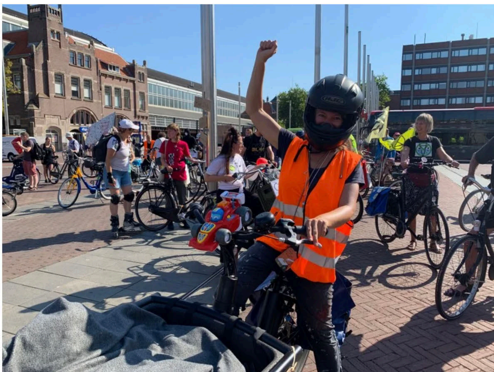
Extinction Rebellion leidt de fietstocht.