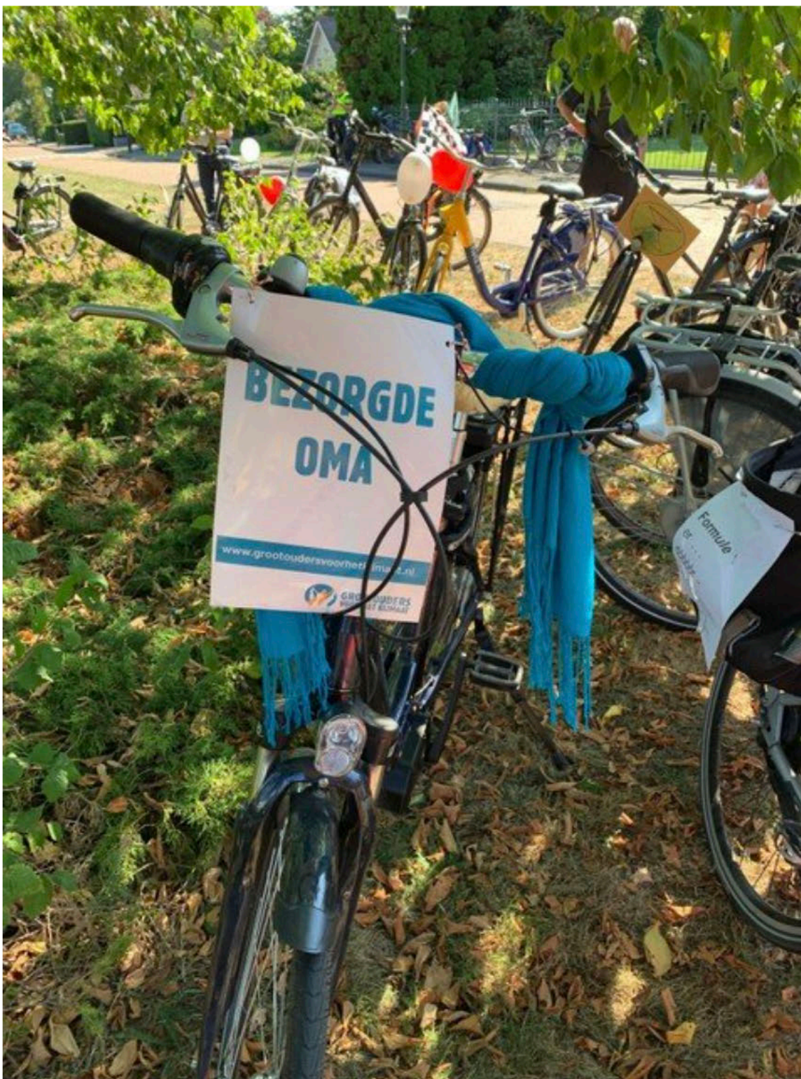
Fiets van een oudere deelnemer.

Op een paar honderd meter van het circuit wordt het eindpunt van de demonstratie bereikt. Er wordt eerst natuurlijk even 'dood gelegen' op een klein duinpannetje. XR doet dat vaker. Als het luchtalarm elke eerste maandag van de maand om 12 uue afgaat, gaat een groep op de grond liggen bij het station van Haarlem. De fans die langs de overkant richting het circuit lopen schudden het hoofd, maar daar blijft het dan ook bij.